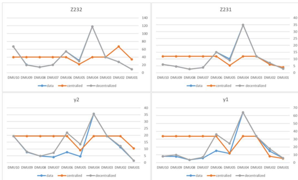
شکل ۳. نقاط تصویر خروجی مدل متمرکز